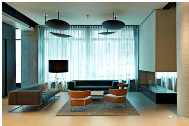
Hotel Barceló Hamburg