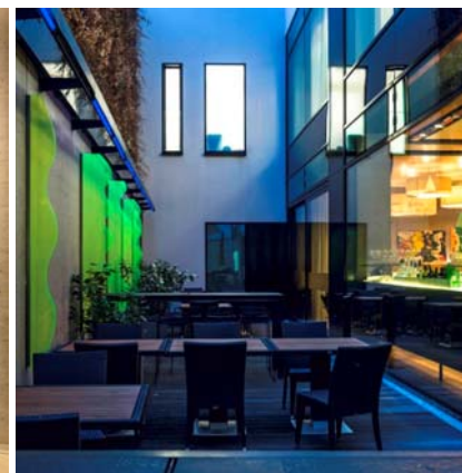
Hotel Barceló Hamburg, Arte: Regine Schumann